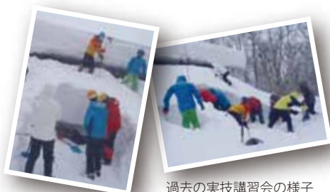
過去の実技講習会の様子