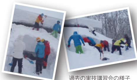
過去の実技講習会の様子